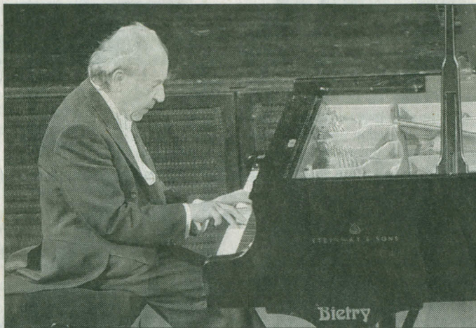
■ Paul Badura-Skoda au Kursaal.

Poids trop grand ? la Partita n° 1 de Bach et la sonate en la mineur de Mozart ont manqué singulièrement de charpente. On n'en fera pas grief à ce grand monsieur du piano qui a offert deux Impromptus de Schubert pleins de charme et de poésie. Mais c'est après l'entracte que Paul Badura-Skoda a livré son plus beau présent : un récital Chopin composé de valse gorgées de fraîcheur et de spontanéité, avec une fluidité et une qualité de toucher remarquables, deux nocturnes de l'opus 27 d'une rare intensité, même si l'interprète, insatisfait de l'un d'eux, l'a repris en bis. Ses mazurkas