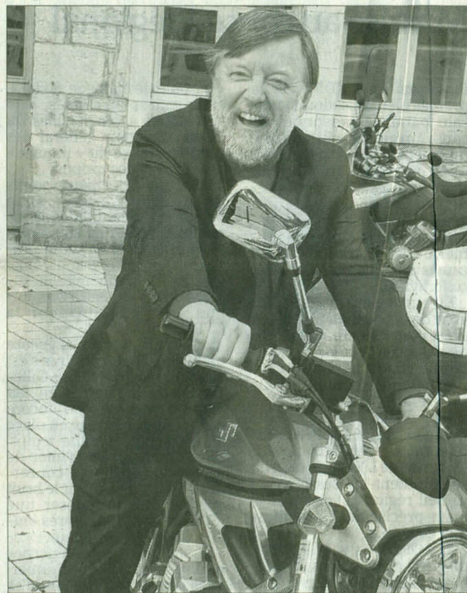
■ Une carrière « sur les chapeaux de roues » pour Sir Andrew Davis.