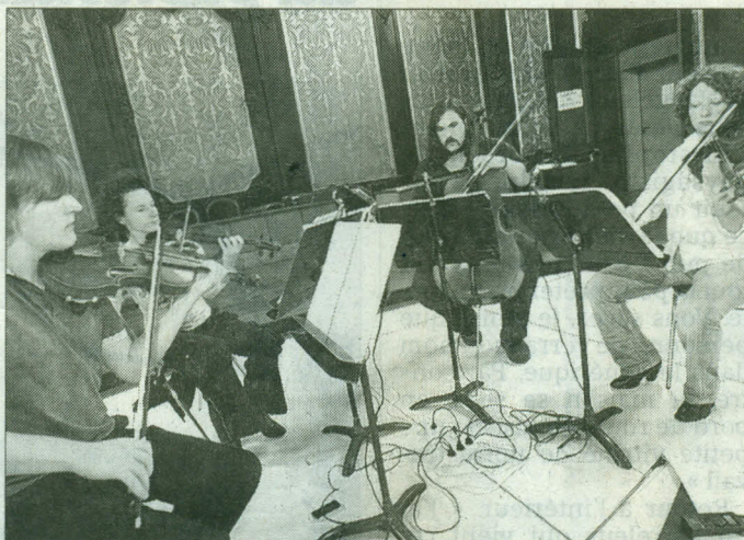
■ Le Quatuor Asasello.