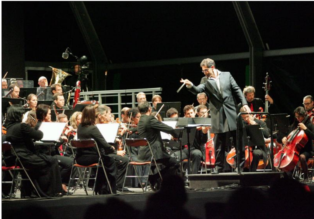
■ Deux Français participeront au Concours de jeunes chefs d'orchestre cette année.

Besançon. Dix jours, trois week-ends et 20.000 à 22.000 personnes attendues. Le Festival de musique de Besançon Franche-Comté finit de se préparer, ne commençant que le 10 septembre prochain. Mais la billetterie, elle, a d'ores et déjà ouvert ses portes depuis le 20 août. Les mélomanes peuvent ainsi acheter leurs places à partir du site Internet du festival et, dès demain mardi 25 août et jusqu'au terme du festival, au Kursaal de Besançon, au sein des pianos-bars ou par téléphone.